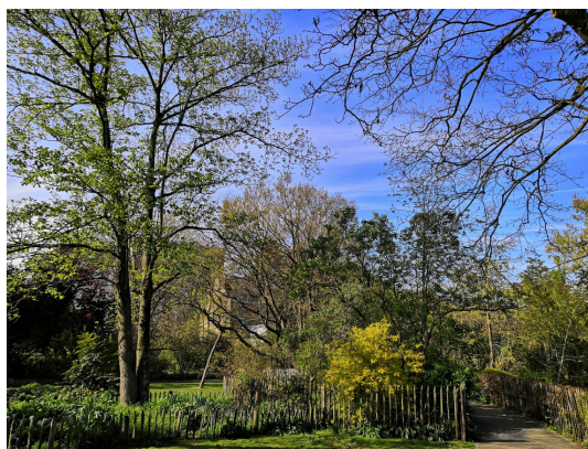
Parc Tenbosch, Avril 2021