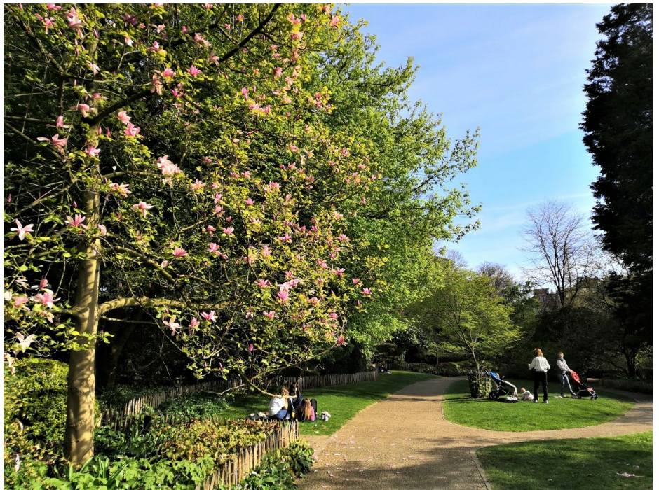
Parc Tenbosch, Avril 2021

Région de Bruxelles Capitale INVENTAIRE DU PATRIMOINE NATUREL