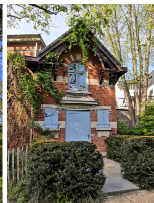
Fabrique de jardin de style pittoresque (1900), locution latine "Ille mihi terrarum praeter omnes angui us ridet" inscrite sur la façade (« Ce coin de terre me sourit plus que tous les autres »).