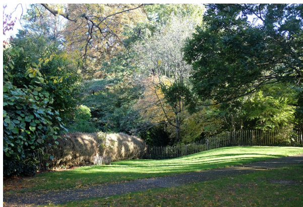
Parc Tenbosch, Octobre 2023