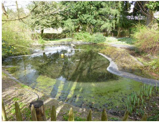
Parc Tenbosch, 2015