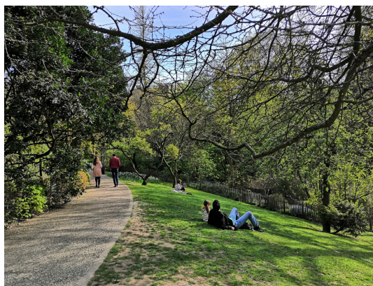
Parc Tenbosch, Avril 2021